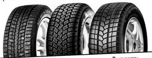
Шипованная Нешипованная «Липучки»

Выбор зимних шин зависит от дорожных условий, в которых чаще всего передвигается автомобиль. Так, если движение практически всегда осуществляется по асфальту, подойдут фрикционные шины, так называемые «липучки». Если часто приходится ездить по заснеженным дорогам, лучше выбрать шипованные шины.